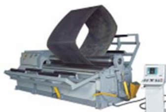
SAHINLER 2, 3, 4 HENGERES LEMEZHENGERÍTŐ GÉPEK