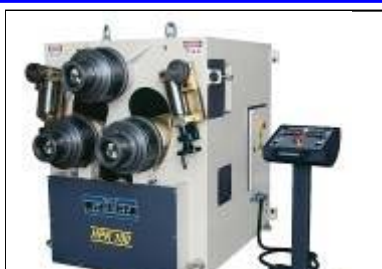
SAHINLER PROFIL & IDOMACÉL HAJLÍTÓ GÉPEK