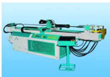
NC/CNC CSÓHAJLÍTÓ GÉPEK