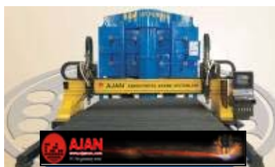
AJAN CNC FINOMSUGARAS PLAZMA ÉS LÁNGVÁGÓ GÉPEK