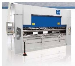
MVD NC/CNC ÉLHAJLÍTÓK