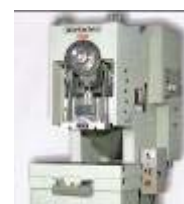
EXCENTER & HIDRAULIKUS PRÉSEK