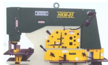
SAHINLER MEGMUNKÁLÓK & LYUKASZTÓ GÉPEK