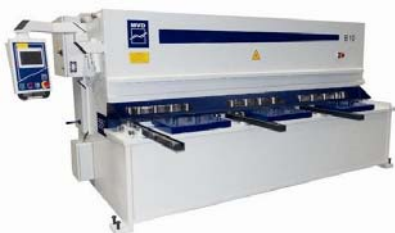
MVD NC/CNC LEMEZOLLÓK