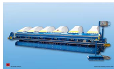
NC/CNC HAJTOGATÓ GÉPEK