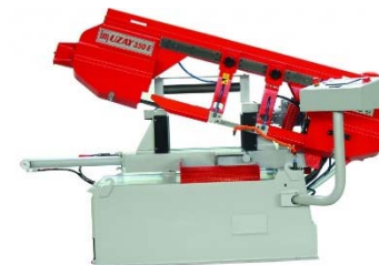
TÁRCSÁS ÉS SZALAGFÜRÉSZ GÉPEK